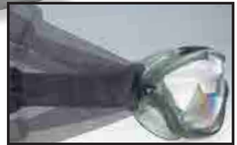
Banda de ajuste giratorio